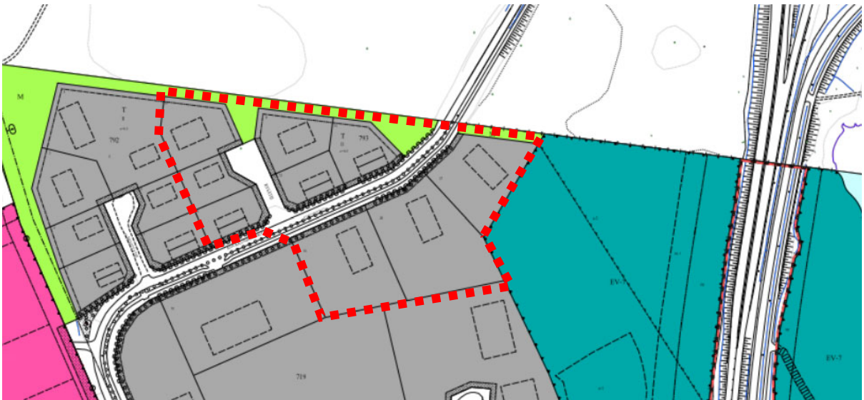
Kuva 3. Ote ajantasa-asemakaavasta. Suunnittelualueeseen sisältyvä alue merkitty punaisella rajauksella.