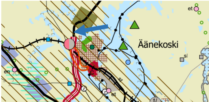
Kuva 1. Ote Keski-Suomen maakuntakaava 2040 yhteydessä esitetystä maakuntakaavayhdistelmästä. Suunnittelualueen sijainti osoitettu sinisellä nuolella.

Keski-Suomen tarkistettu maakuntakaava on hyväksytty maakuntavaltuustossa 1.12.2017 ja se on tullut voimaan 26.1.2018. Koko Keski-Suomi on maakuntakaavassa osoitettu biotalouteen tukeutuvaksi alueeksi. Suunnittelualue on moottori- tai moottoriliikennetien, uusi (punainen viiva, mo) ja vt 4 kehittämissakselin (vihertävä neliö) varrella, kulttuuriympäristön vetovoima-alue (ruskea vinorasteri). Lisäksi alueelle on osoitettu monipuolista työpaikka-alue (vaaleanpuna-harmaa ympyrä).