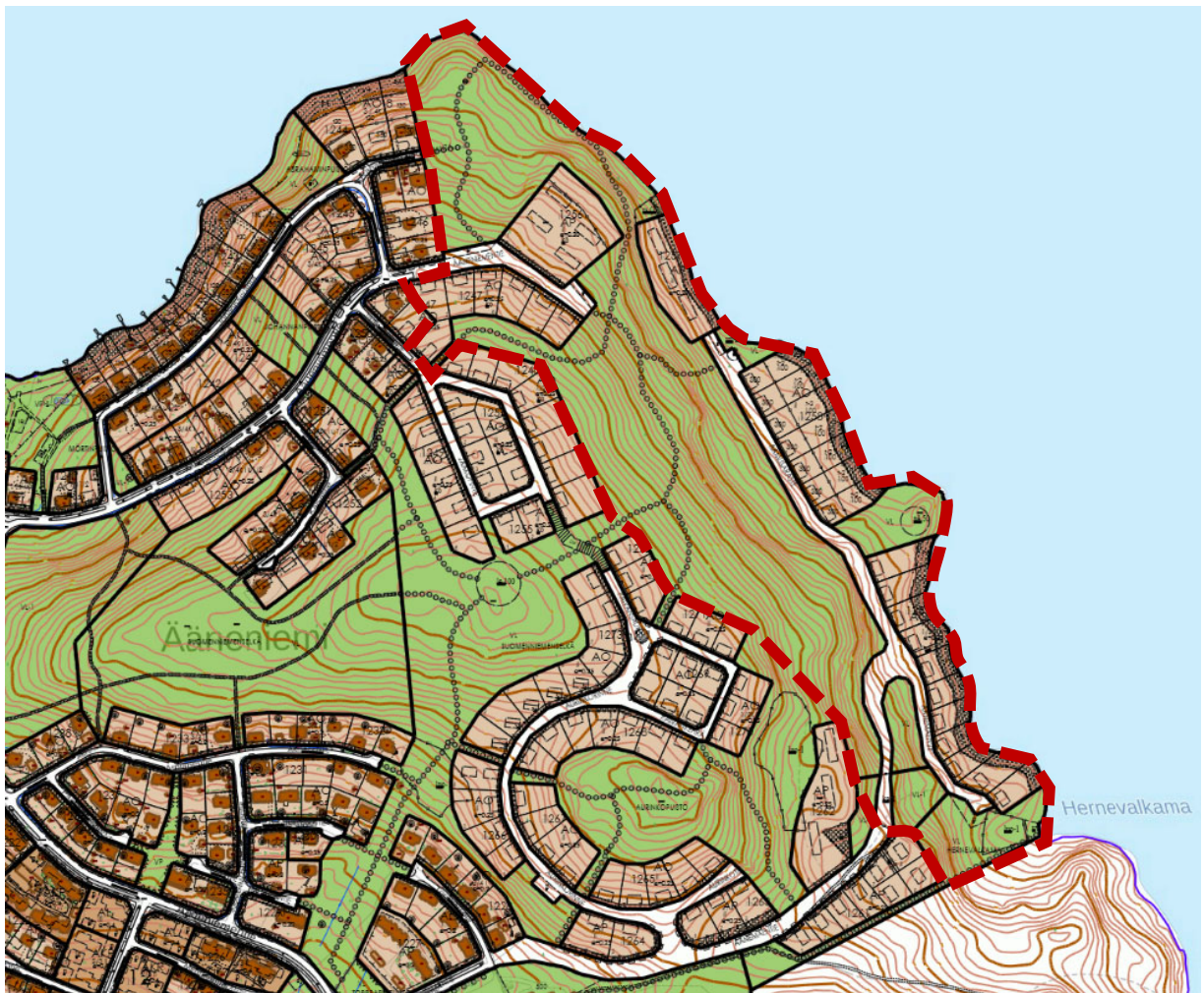
Kuva 3. Ote ajantasa-asemakaavasta. Suunnittelualue on rajattu punaisella.