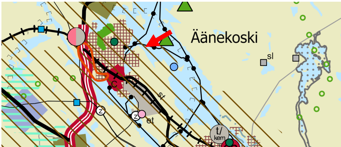
Kuva 1. Ote Keski-Suomen maakuntakaavasta, sijainti osoitettu punaisella nuolella.